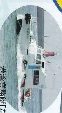
港湾業務艇「なおかぜ」