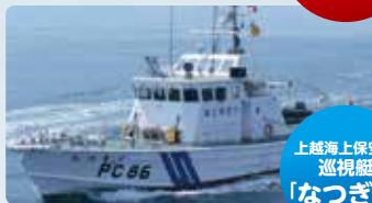
上越海上保安署 巡視艇 「なつぎり」