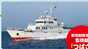
新潟税関支署 監視艇 「つばさ」