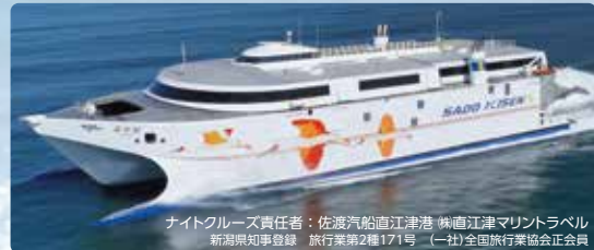
ナイトクルーズ責任者：佐渡汽船直江津港 株式会社直江津マリントラベル 新潟県知事登録 旅行業第2種171号 (一社)全国旅行業協会正会員