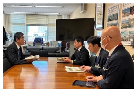
【国土交通省 稲田港湾局長への要望】